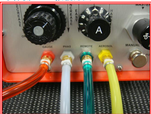
本体側正しい接続方法